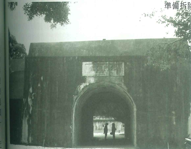
滬尾台北門鎖鑰

從歷史的角度看，滬尾砲台的故事應該拉到1884年的清法戰爭，甚至更早之前。1884年6月，法國已準備發動戰爭，清廷聞訊也命劉銘傳巡撫督辦台灣防務，劉銘傳當時即令孫開華提督趕工