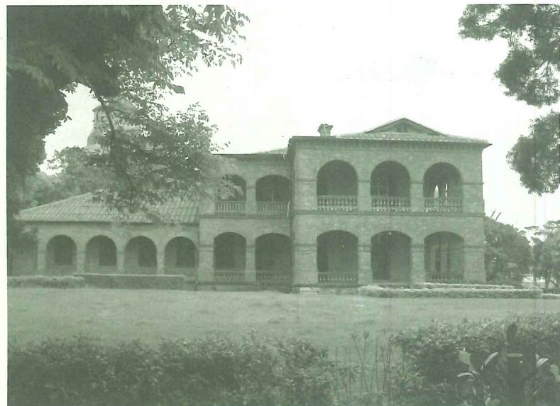
▼英國領事館

從九十三年三月一日紅毛城封園迄今，將600個日子，台北縣政府由副縣長專案監督古蹟