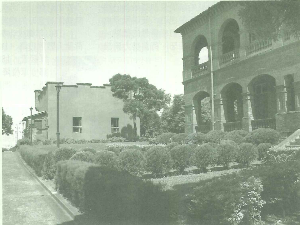
紅毛城一隅

紅毛城二十年來第一次封園修復，我們期待再次開放的它、滬尾砲台，還有第一次開放的小白宮，在一系列的活動中，能讓民眾認識它、親近它、甚而愛上它！而園區將用最誠摯的心邀請您！十一月十日和我們一起「愛戀紅城」，用真情迎接風華再現的紅毛城！