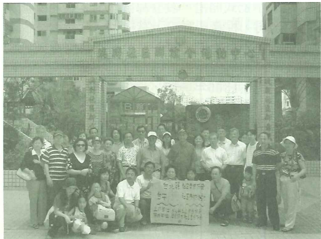
▲台中社區參訪

在一個社區裏舊居民及新居民，彼此的需要可能不同，如何協調合作，共同尋求理想的解決方式，也是需要大家理性而有智慧的解決。無論面對如何困難，在社區改造過程中，都要耐心的探討。有一個新的夢想，較好的願景，總比悻悻懂懂的一日過一日有意義得多。深切的希望大家共同熱心參與社區改造的工作，使我們的社區更美好，生活品質更提高。